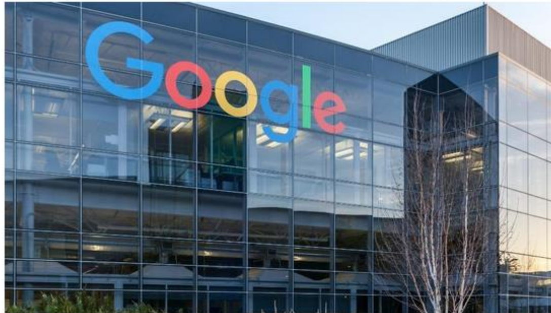
Sede do Google em Mountain View