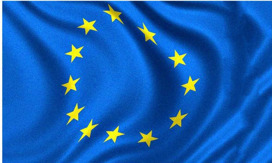
European Union flag

✉️ 🖨️ 📁 🐦 Twitter 📘 Facebook 🌐 LinkedIn ⭐ Credit Eligible 📄 Get Permission